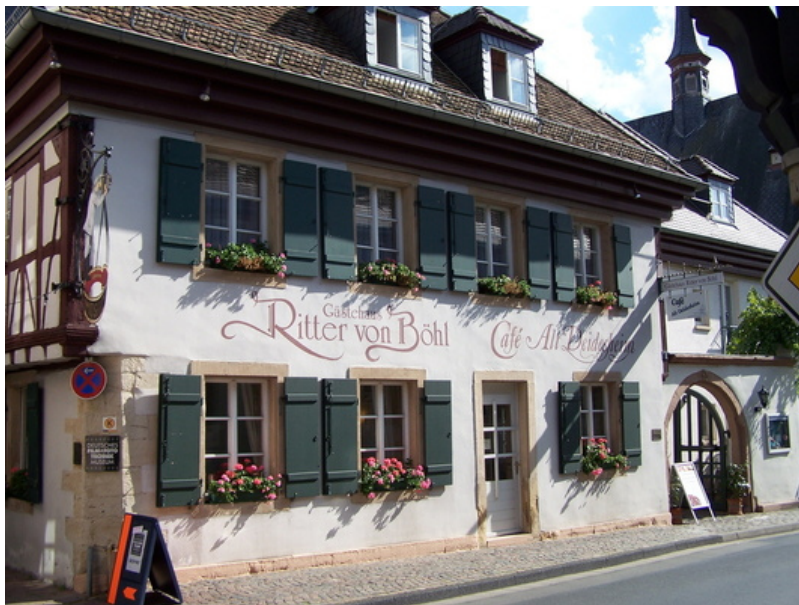
Außenansicht Hotel Ritter von Böhl